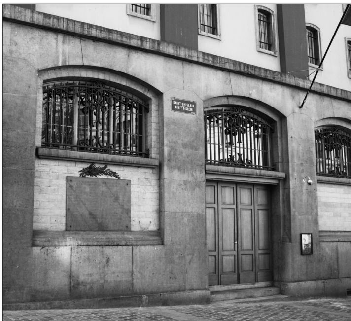
Le Mont-de-Piété, Bruxelles.