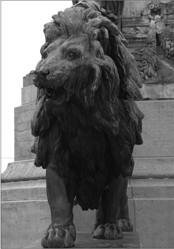
Eugène Simonis, Lion de bronze, Colonne du Congrès, 1863.

Participation aux frais pour la promenade guidée : Les bronzes, couronnement d'un aménagement urbain