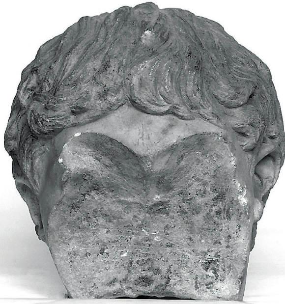
Tête en marbre de l'empereur Geta vandalisée avec un ciseau suite à l'acte de damnatio memoriae , c. 200 après J.C.

L'invention de l'imprimerie a permis d'accéder à une quantité d'informations mais la croissance des savoirs diffusés était loin d'en garantir l'exactitude. Pour s'assurer gloire et fortune, certains n'hésitaient pas à propager de fausses nouvelles à un public avide de sensation. Même dans le domaine de la science, certains résultats ont été délibérément transformés. Certes le caractère falsifiable de la science, qui expose toute théorie à l'éventualité d'être invalidée, n'est pas un défaut. Il s'agit d'une caractéristique essentielle de la méthode scientifique, qui la distingue de tous les autres systèmes tentant de donner un sens au monde. La recherche empirique se base sur l'observation des faits. Or, les scientifiques ne sont pas à l'abri de la partialité. Certains ont été jusqu'à falsifier des résultats pour leur propre profit.