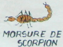
MORSURE DE SCORPION