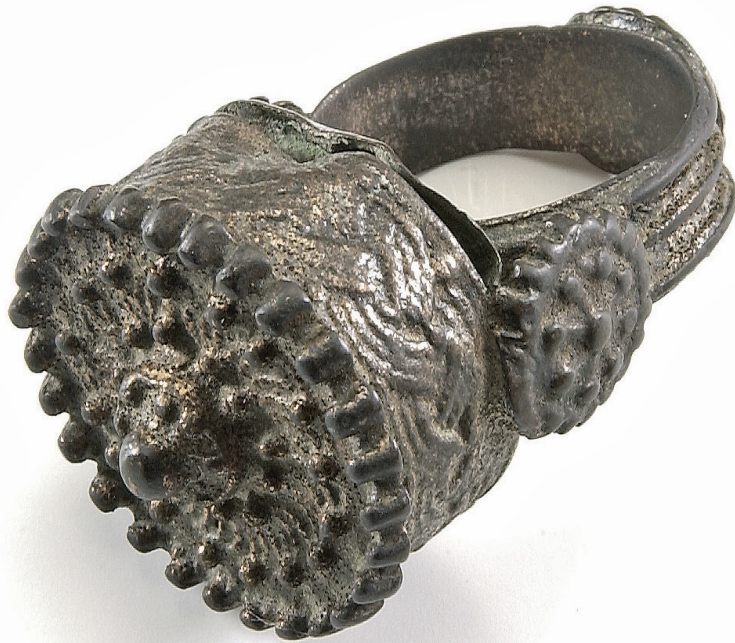
Bague reliquaire, Utrecht, ca.475-550