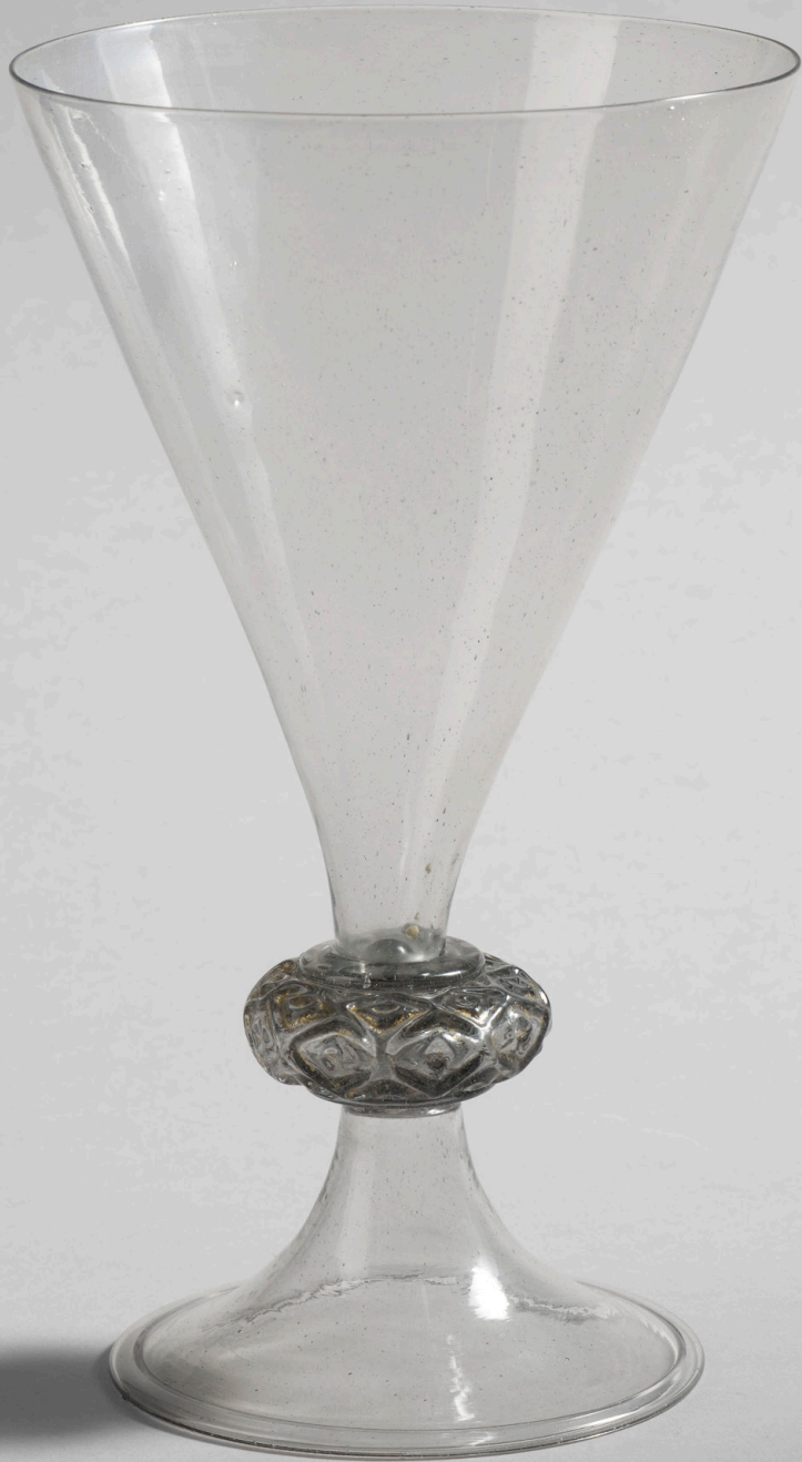
Verre à pied ou calice, 1520-1550, verre incolore soufflé et dorure, Venise.