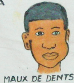
MAUX DE DENTS