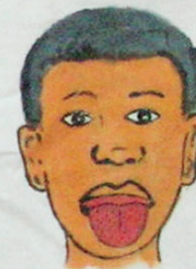
MAUX DE LANGUE