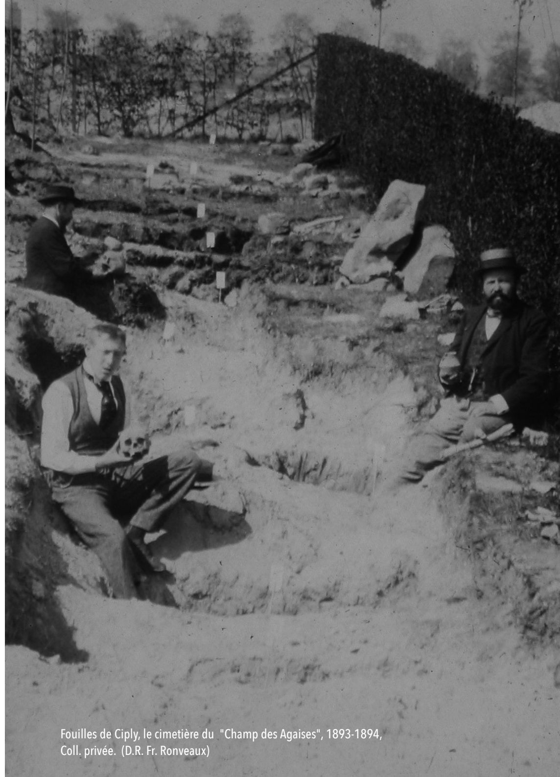
Fouilles de Cibly, le cimetière du "Champ des Agaises", 1893-1894