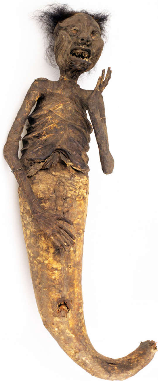
Figure d'un ningyo, le "poisson humain", Japon, 1800-1823

ont permis de réaliser des actes de sabotage et d'espionnage audacieux, de franchir des frontières, d'empêcher certaines personnes de mourir de faim en imitant les cartes de rationnement. Autre leurre de l'époque, des poupées parachutistes furent utilisées afin de détourner l'attention des sites où étaient largués de vrais soldats. En 1940, les forces allemandes occupant la Belgique et les Pays-Bas eurent recours à ces mannequins équipés de systèmes d'autodestruction. Bien peu nous sont parvenus intacts.