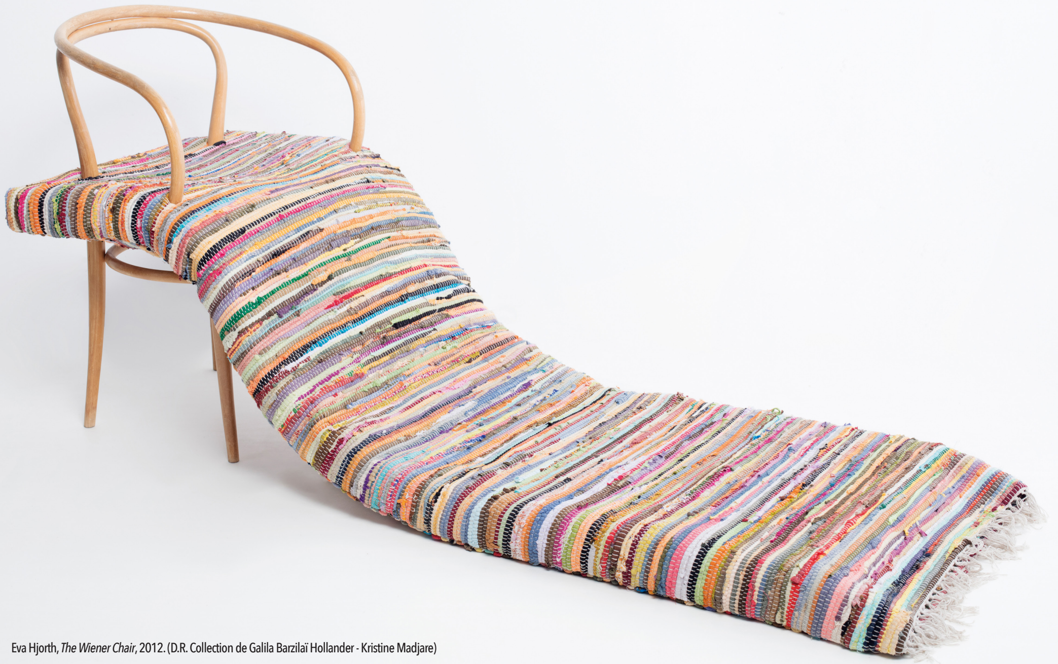
Eva Hjorth, The Wiener Chair , 2012.