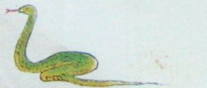
MORSURE DE SERPENT