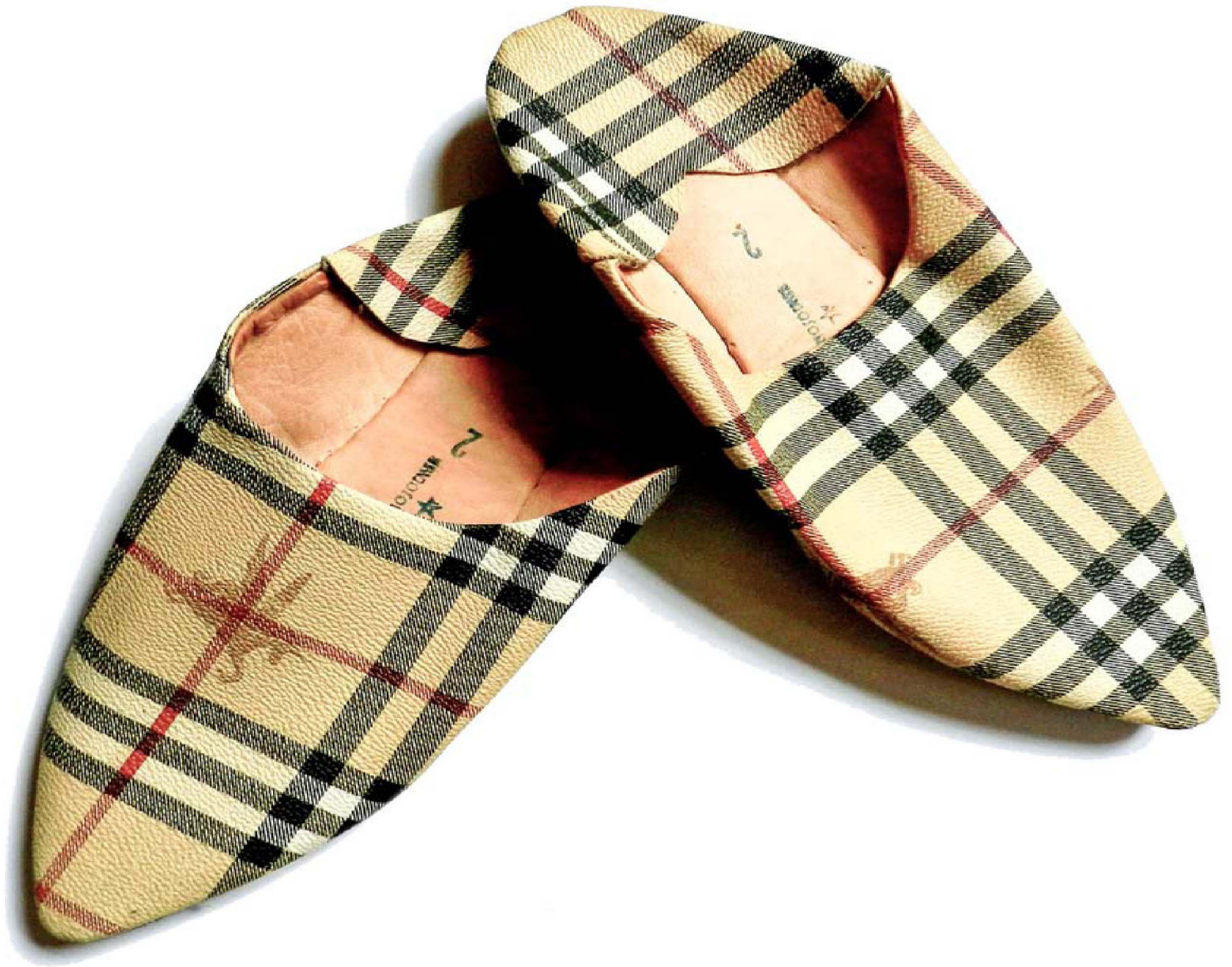
Faussees babouches Burberry.