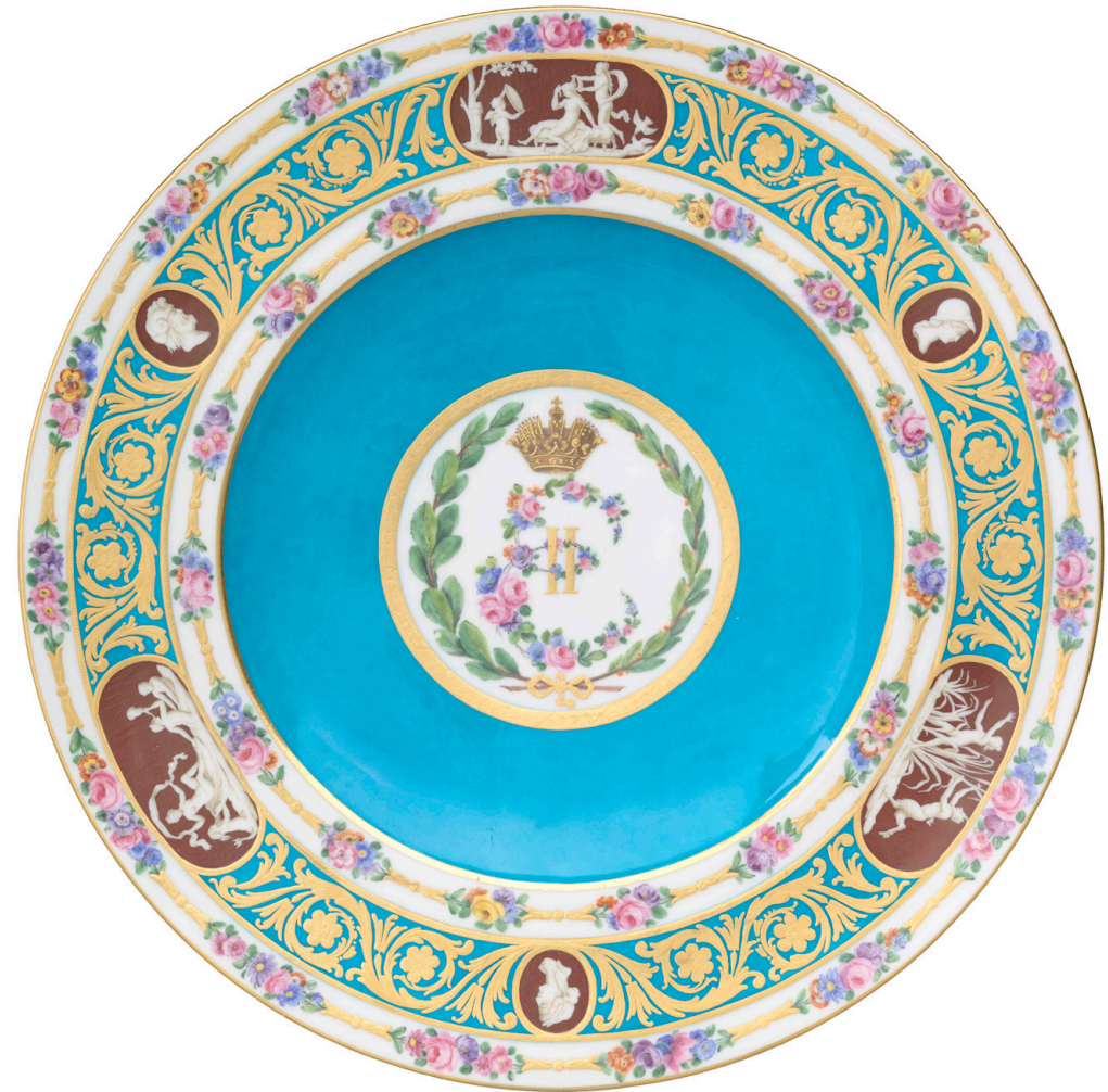
Assiette du service "aux camées" de Catherine II de Russie, 1778, porcelaine tendre, Manufacture royale de Sèvres.

A partir du XIX e siècle, la gastronomie entre vraiment au coeur de la sociabilité française. L'évolution se poursuit : les heures de repas sont désormais celles que nous connaissons aujourd'hui. Le service "à la russe" (les mets sont apportés les uns après les autres) s'impose au détriment du service à la française tandis que les verres restent désormais à table. Les restaurants connaissent une vogue qui ne démentira pas. Les cuisiniers, les "chefs", profitent de cet engouement pour acquérir une célébrité que n'entament ni le temps et ni l'espace : Antonin Carême, Jules Gouffé ou