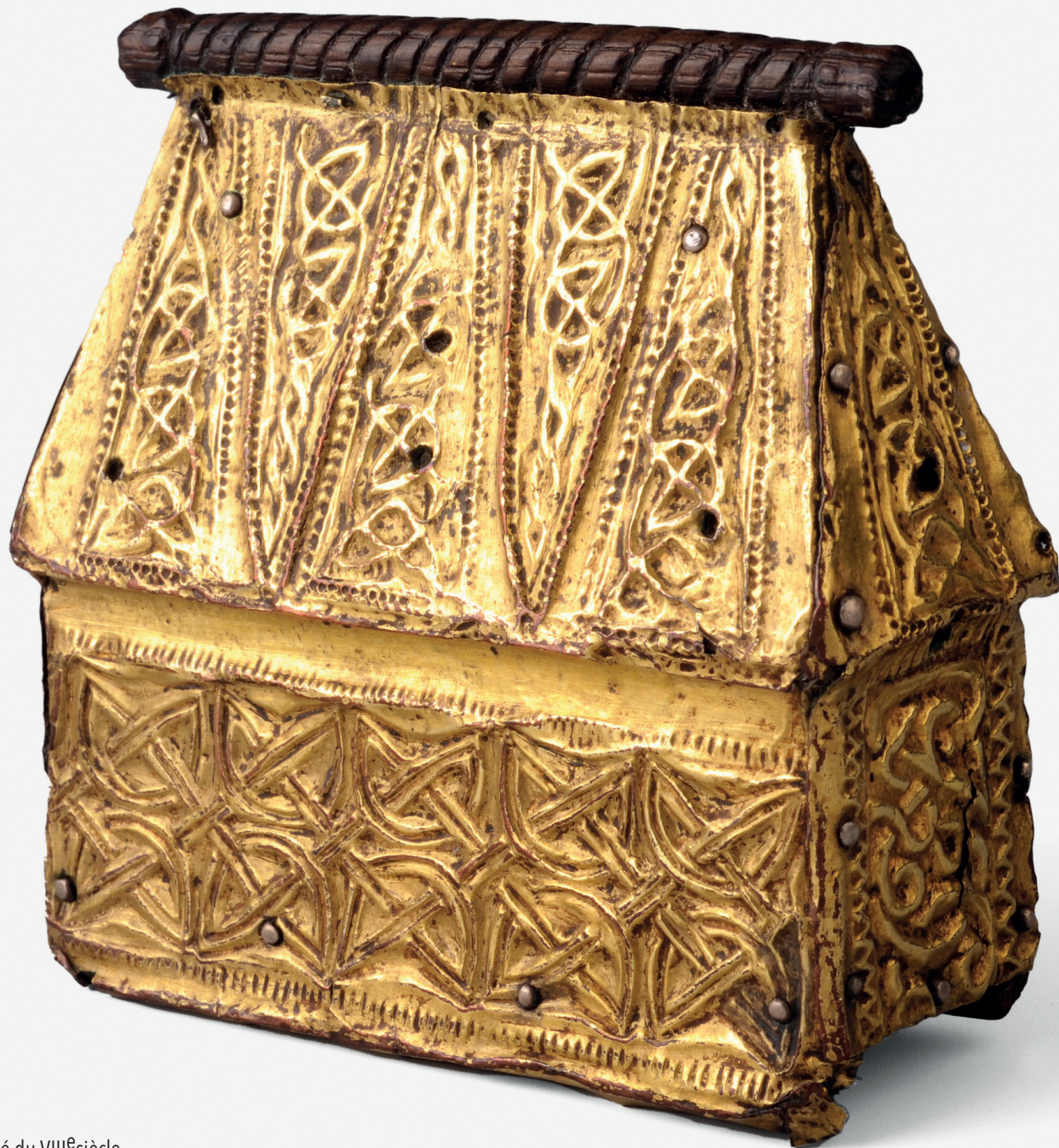
Reliquaire portatif, chêne, cuivre doré, argent, 1 er moitié du VIII e siècle.