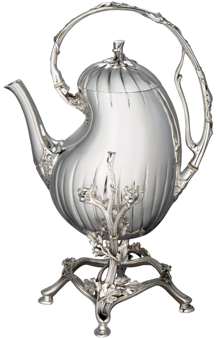
Léon Mallet, Bouilloire à bascule courge, Christofle, 1891, métal argenté.