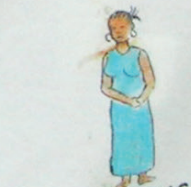
MAUX DE BAS VENTRE