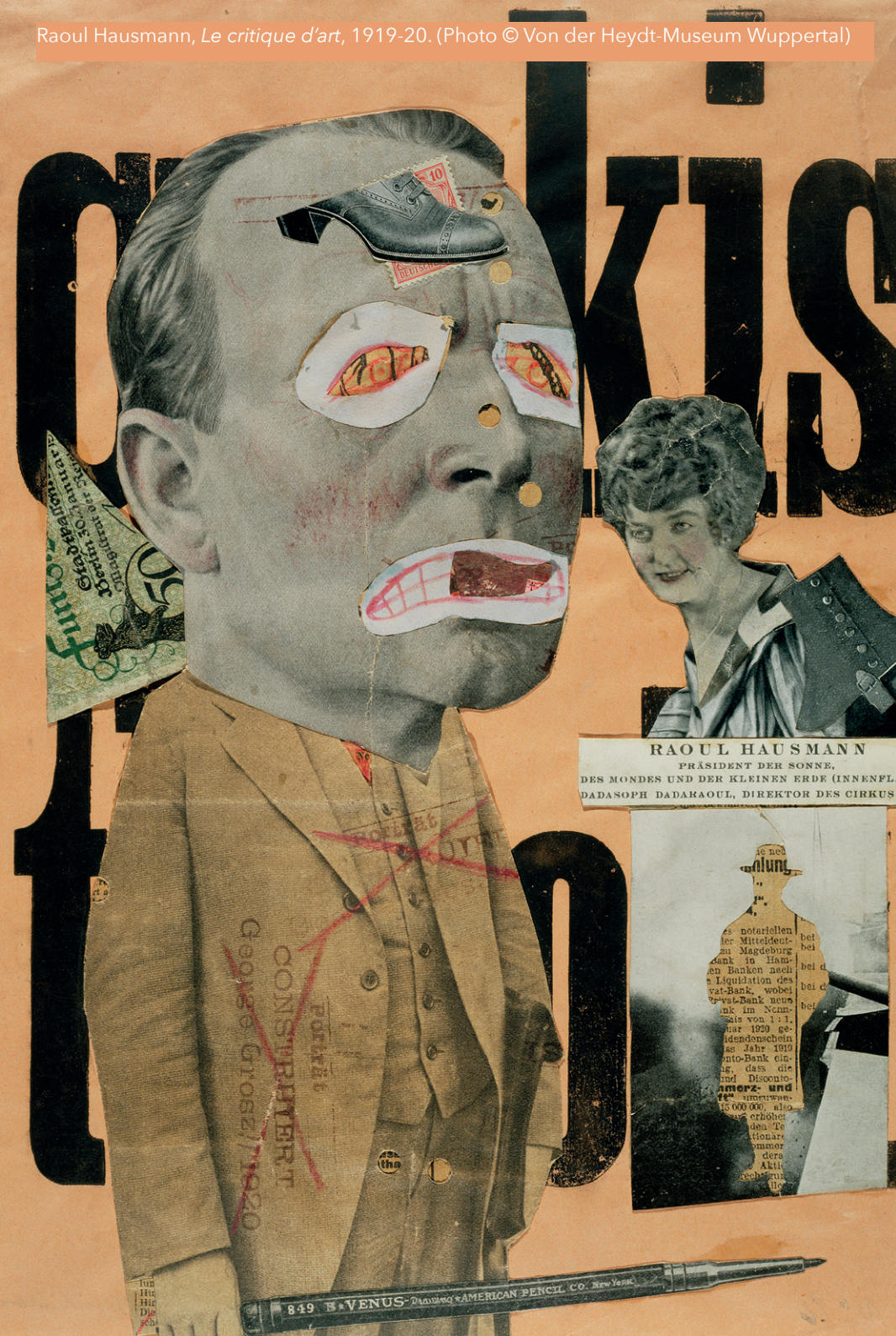
RAOUL HAUSMANN PRÉSIDENT DER SONNE, DES MONDES UND DER KLEINEN ERDE (INNENFL.), DADASOPH DADAKAOU, DIREKTOR DES CIRKUS

es notariellen der Mitteldeut- zu Magdeburg Bank in Han- en Banken nach Liquidation des vat-Bank, wobei vat-Bank neun nk im Nenn- nis von 1:1. zur 1920 ge- idendenschein se Jahr 1919 nto-Bank ein- s, dass die und Disconto- amorz- und amurwan- is 600 000, ab- erhöher den Te tionare manor dera Akti rech-Sum the