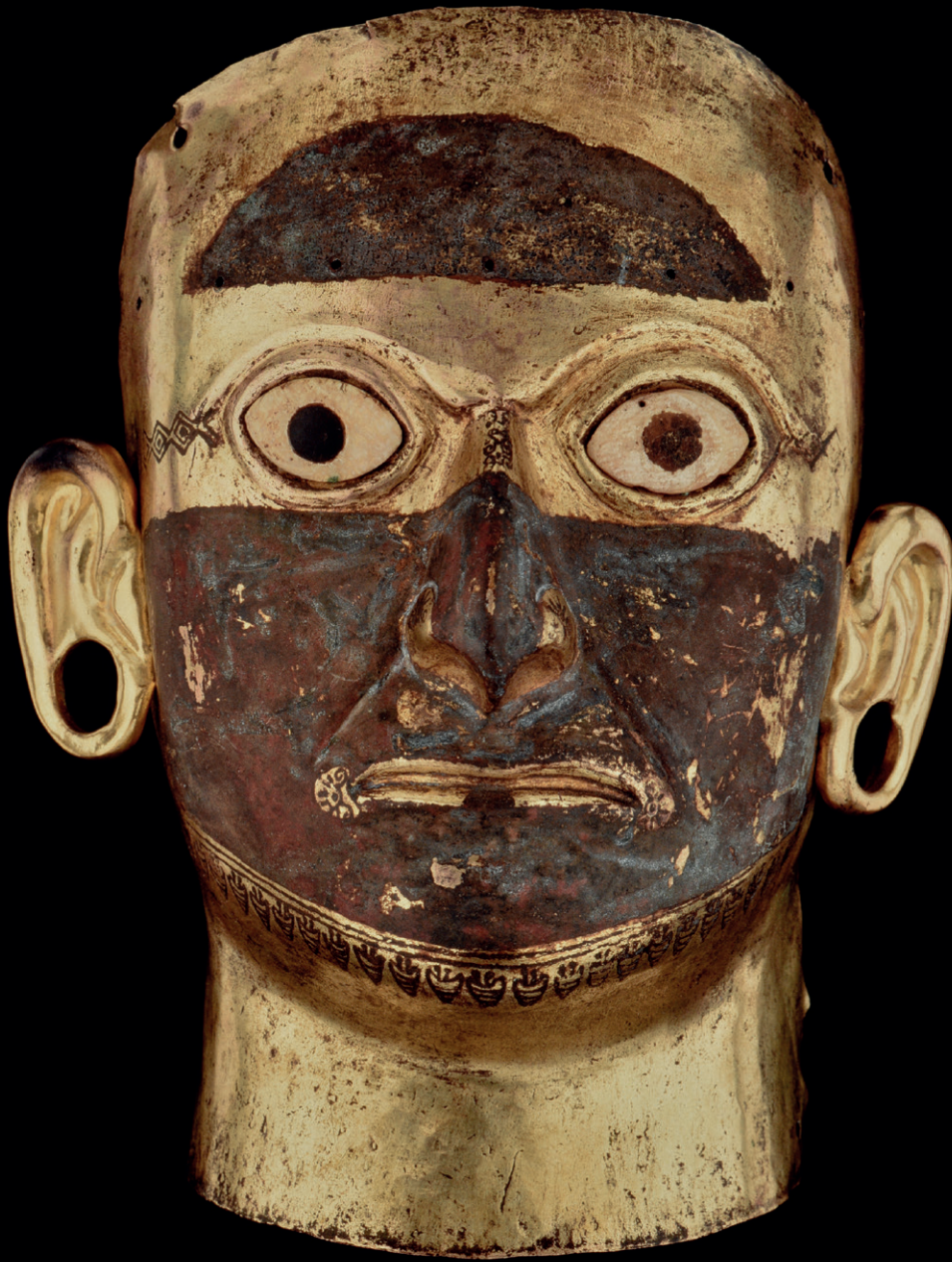
Masque funéraire, Pérou - Côte Nord, culture Mochica, 100 - 600 ap. J.-C. eyer