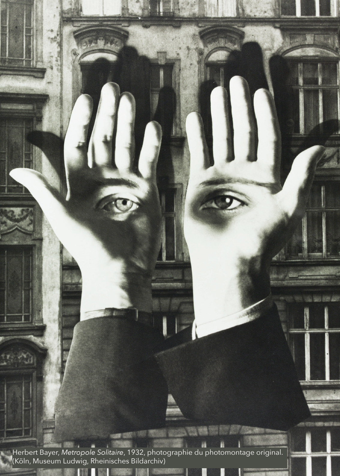
Herbert Bayer, Metropole Solitaire , 1932, photographie du photomontage original. (Köln, Museum Ludwig, Rheinisches Bildarchiv)