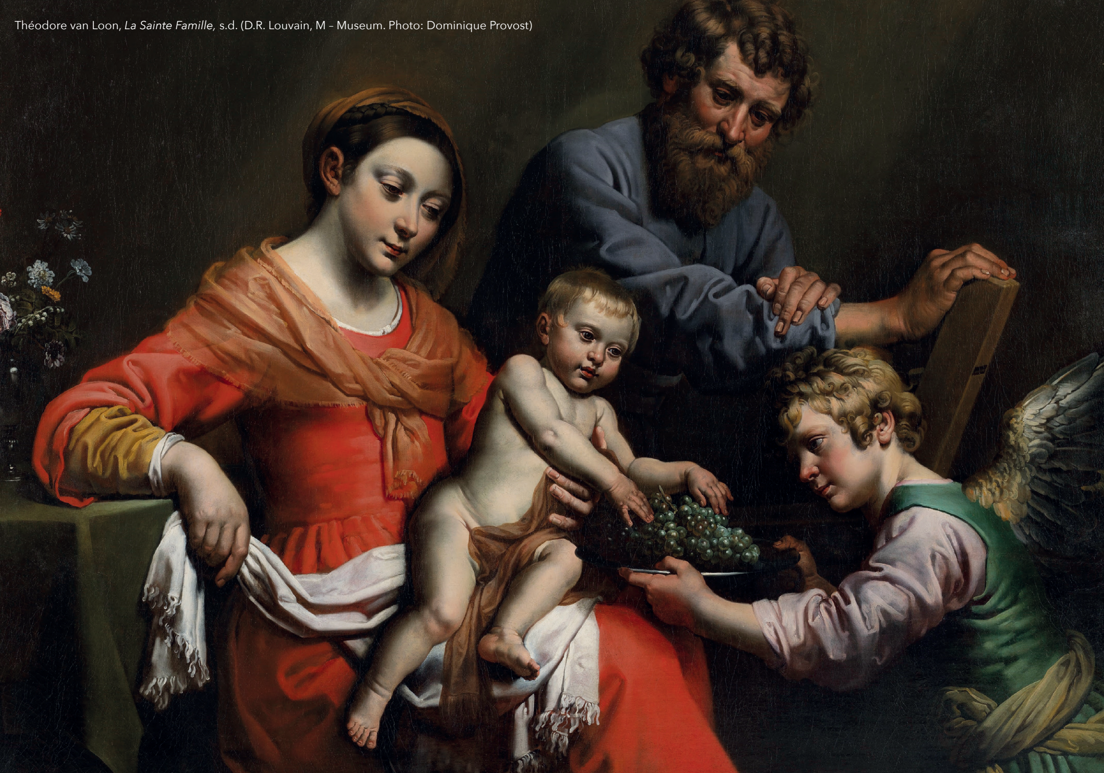
Théodore van Loon, La Sainte Famille , s.d. (D.R. Louvain, M - Museum. Photo: Dominique Provost)