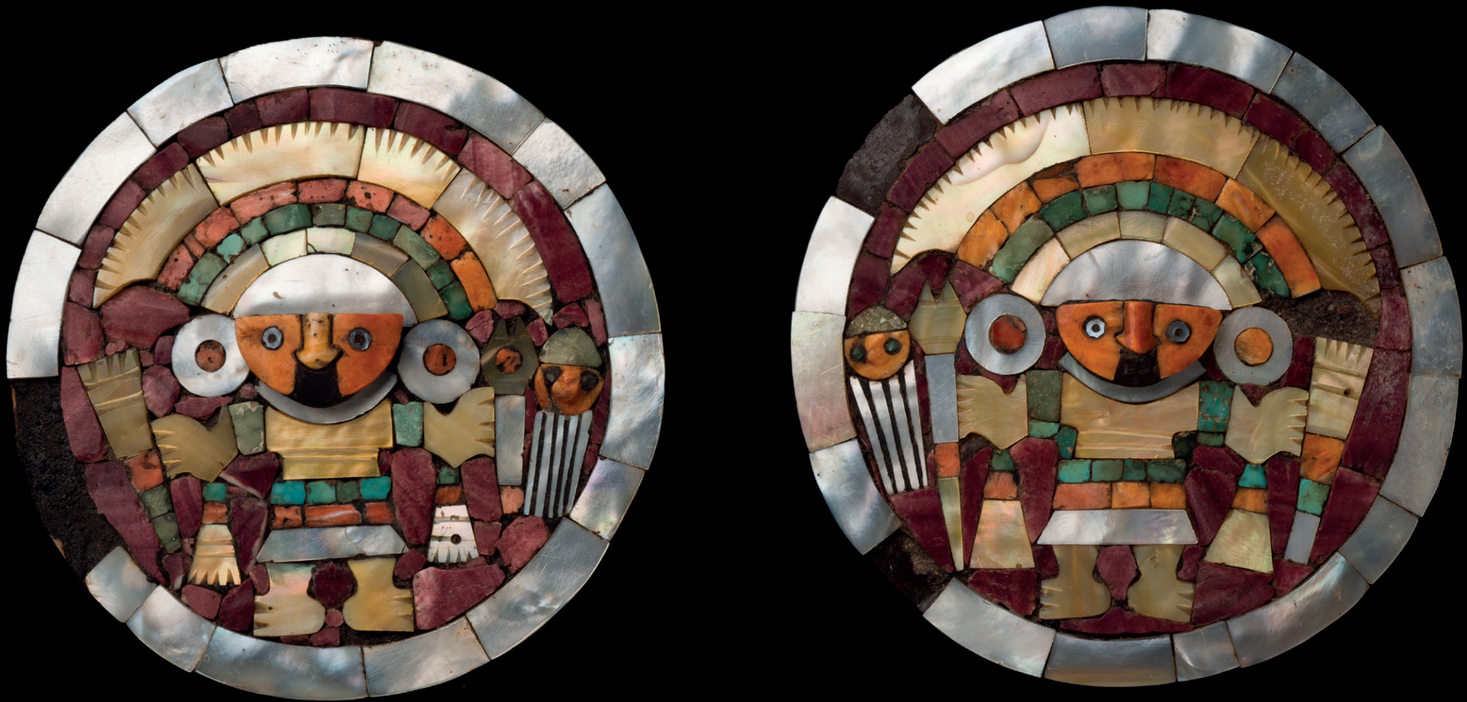
Paire d'ornements d'oreilles, Pérou - Côte Nord, culture Chimú 1100 - 1470 ap. J.-C. (D.R. Linden-Museum Stuttgart.)