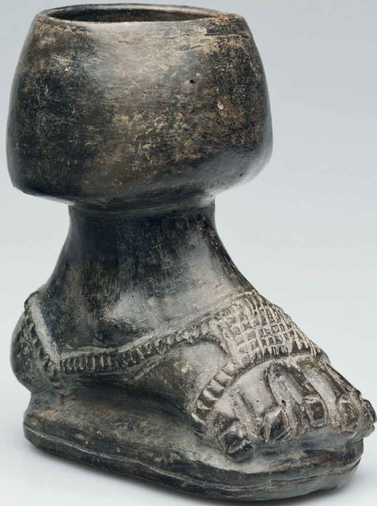
Vase en forme de pied, Pérou - Côte Nord, Chimu-Inca, terre cuite, 1470 - 1532 ap. J.-C.

êtres surnaturels. La palette de couleurs atteint deux cent teintes. Par ailleurs, certains tissus s'avèrent très grands : ils peuvent atteindre plus de vingt mètres de long sur trois de large. Les spécialistes avancent que les tissus peints – évidemment moins longs à réaliser – servaient à délivrer des messages et jouaient le rôle d'affiches de propagande.