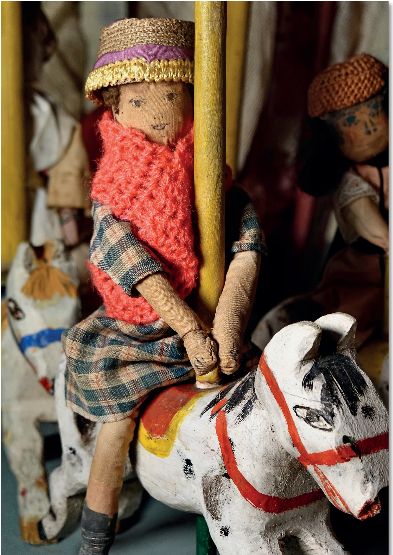
Ci-dessus : Edgard Tytgat, Carousel (détail), ca.1916, Collection Musée de Woluwe.