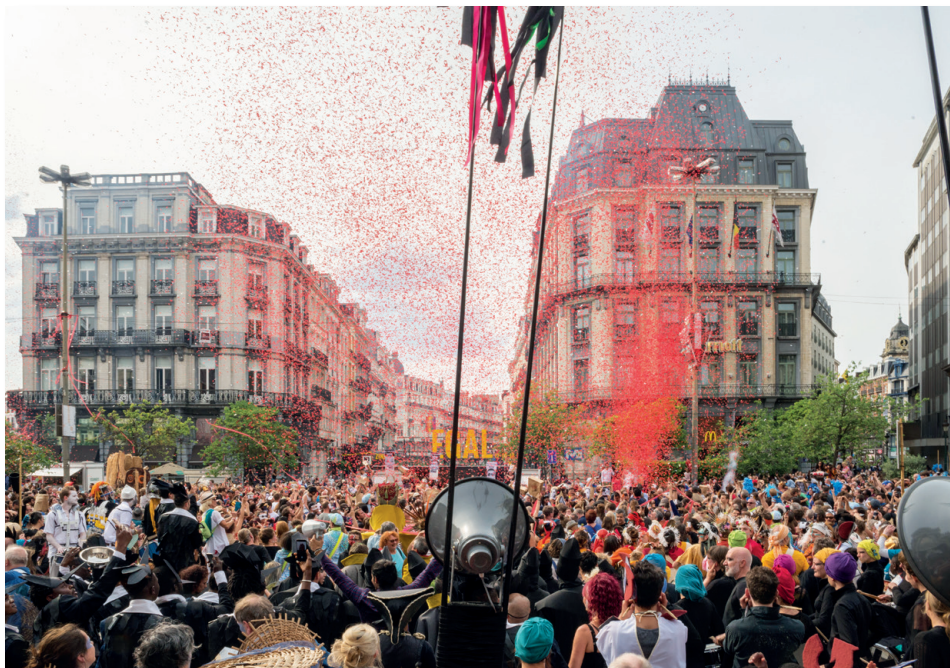
La Zinneke Parade sur les boulevards.

La treizième sortie de la Zinneke Parade aura lieu le samedi 1 er juin 2024 dans le centre de Bruxelles. Son thème en sera "PlaiZir". www.zinneke.org