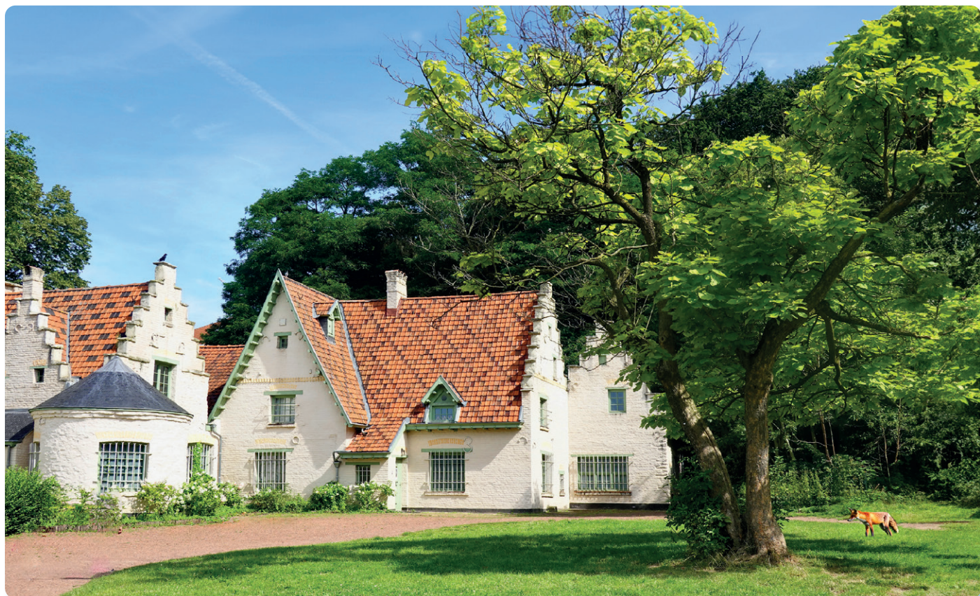
Le Musée de Woluwe dans le Parc de Roodebeek